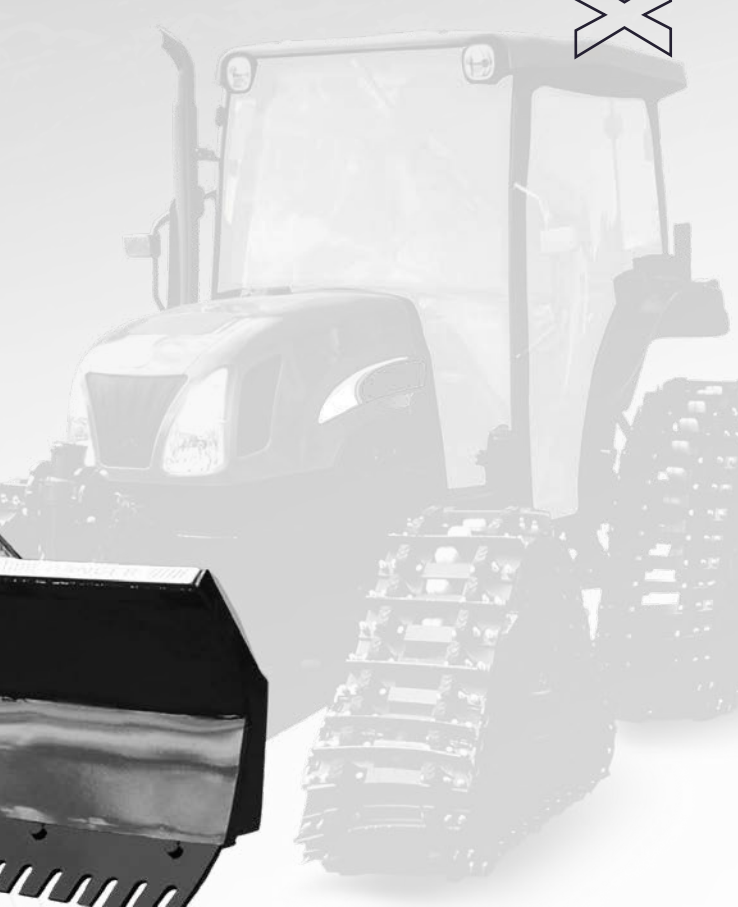
POSITIONS DE LA LAME